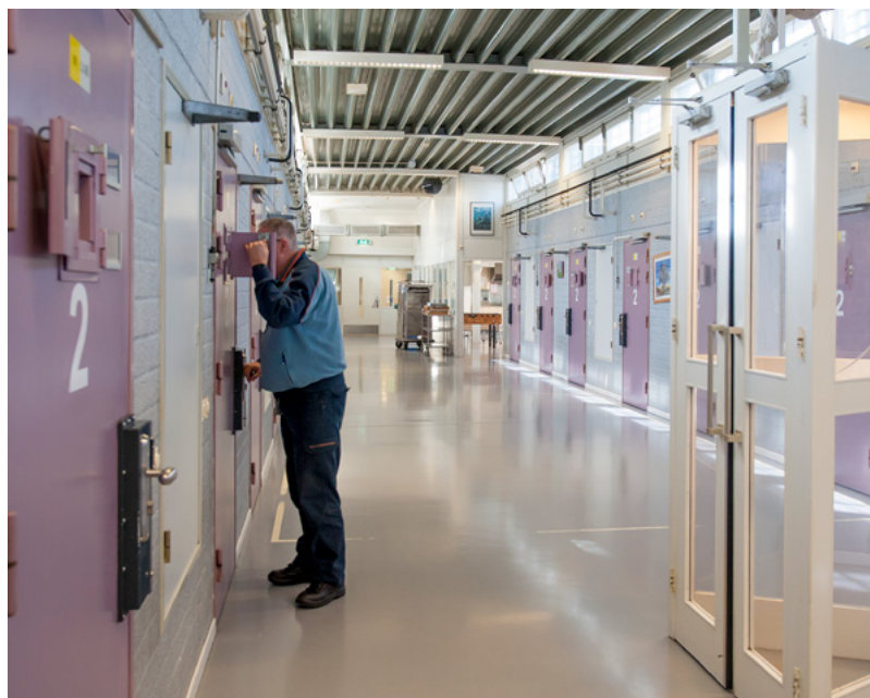
De cipier controleert of alles nog goed gaat met de arrestanten.

lastig te realiseren. Gevangenen namen na 17:00 uur in principe geen nieuwe gedetineerden meer op. Ook was in de avonduren niet overal een medische dienst aanwezig. ‘Volgens de wet moet je iemand de eerstvolgende werkdag medisch bekijken. Het kan dus gebeuren dat iemand een heel weekend moet wachten. Onacceptabel. Onder de arrestanten bevinden zich veel zwervers, die kampen met psychische problemen en verslavingen.’ Daarom werden er in 2014 drie inrichtingen aangewezen, waar arrestanten naartoe