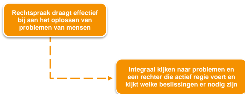
Figuur 1. Voorbeeld van een hoofddoel en subdoel

Wat hierbij helpend kan zijn, is het opstellen van een doelenboom . Een doelenboom helpt je een visie te vertalen in concrete, bereikbare doelen en kan zorgen voor beweging. Een doelenboom dwingt om doelen realistisch en meetbaar te maken, zodat tastbare resultaten waarschijnlijker zijn. Met een doelenboom wordt vooraf nagedacht over het hoofddoel van een aanpak of project. Vervolgens worden er subdoelen (meer specifiek) gesteld, die gerelateerd zijn aan het hoofddoel. Door het gebruik van een doelenboom, kan een globaal doel geconcretiseerd worden naar praktische doelstellingen.